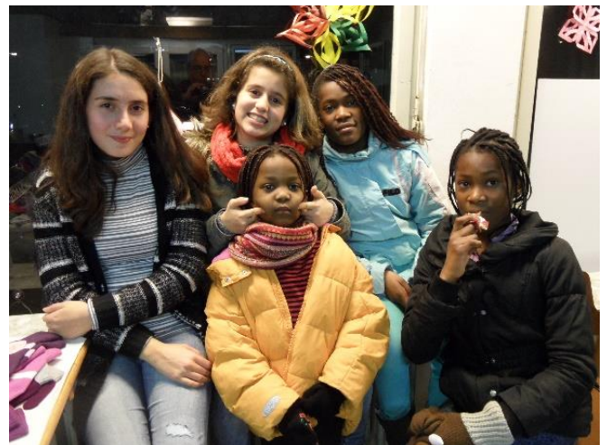
Kinder gehören dazu – bei jedem Fest!