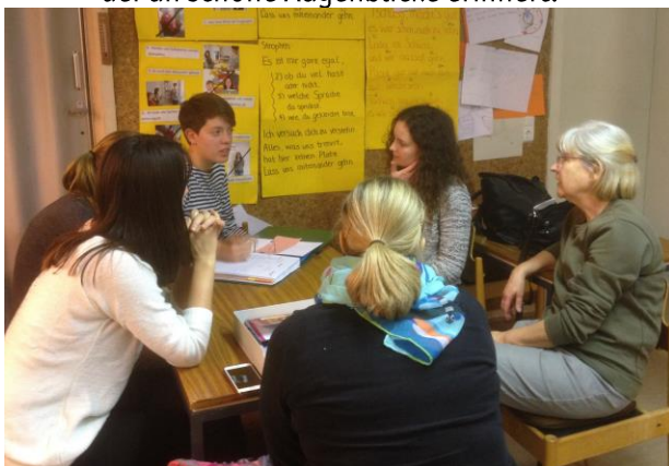
Nachbesprechung nach einem turbulenten InselArche-Tag