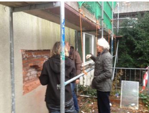
Links: Fachleute überprüfen das Mauerwerk und die alte Isolierung der Fassade.

Rechts: Baubesprechung nachdem Stahlträger als Unterzüge eingebracht wurden, die das Dach tragen.