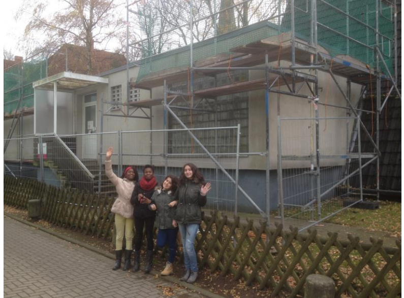
Zuerst kamen der Bauzaun und das Gerüst. Links: Mehrere Zwischenwände wurden abgerissen. In Hintergrund das Regenbogenbild, das die Kinder im Oktober gemalt haben.